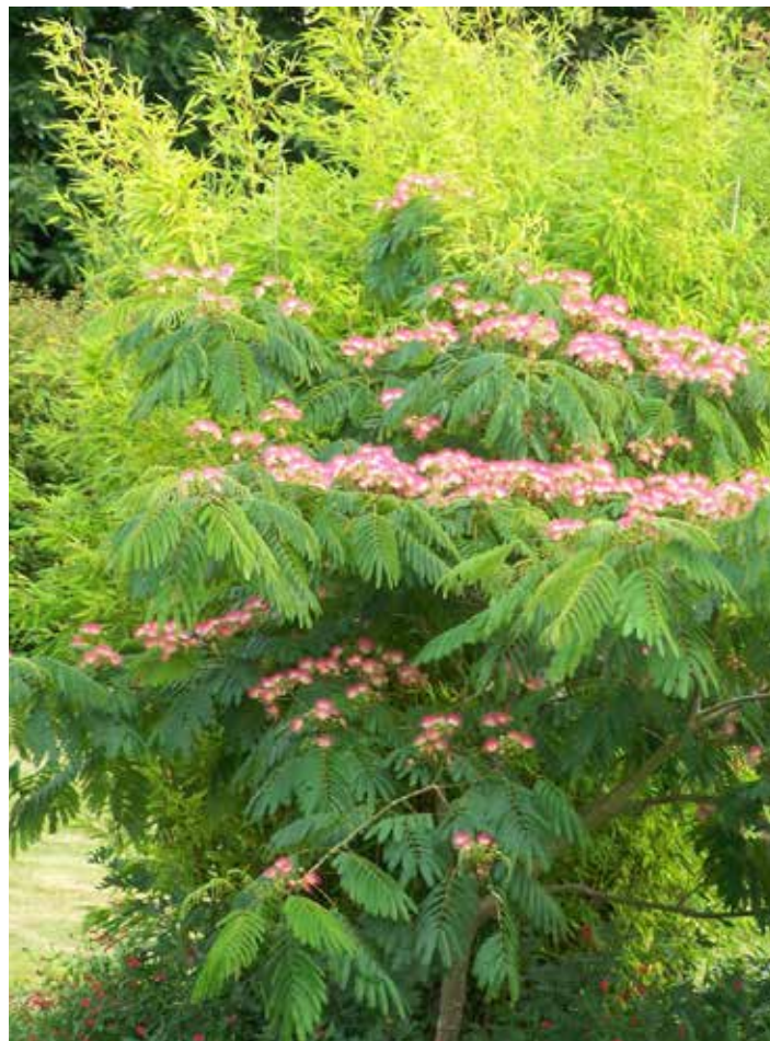
anders & anders